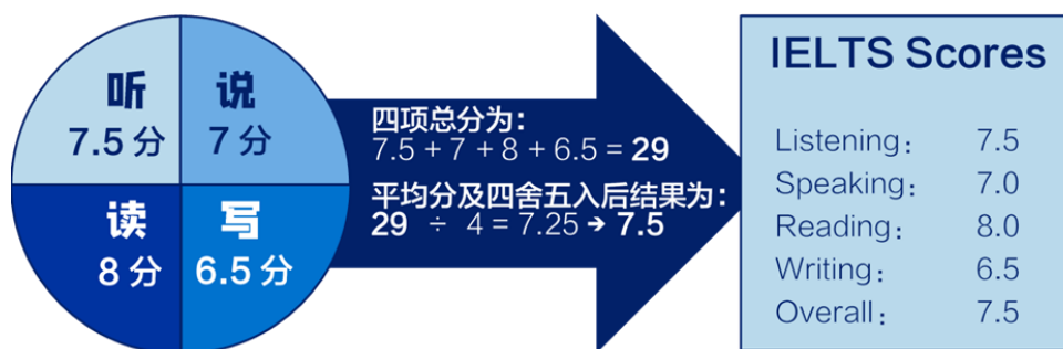
雅思得分及成绩单示意图

雅思考试分为听说读写四个部分，各项最高分是9分，各级别相差0.5分；最后总分是四项考试得分经过四舍五入后的算数平均分，最高分9分，各个级别之间相差0.5分。